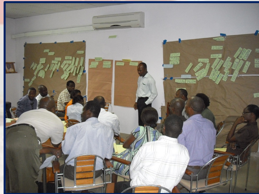
Proceso consultivo para preparar Diagnóstico