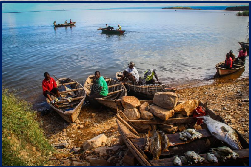
Pesca artesanal, Lago Tanganica