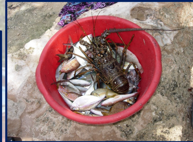
Pescado fresco preparado para transporte y venta