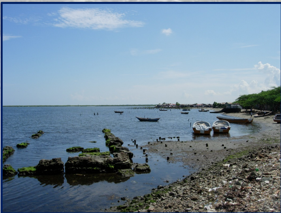
Infraestructuras en mal estado