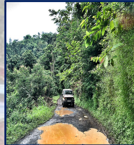
Transporte (Sao Tomé)