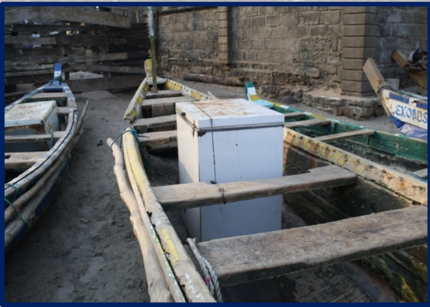
Captura y post-captura (Ghana)