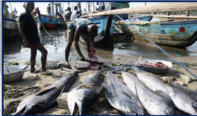
Transformación y venta (Ghana, Senegal)