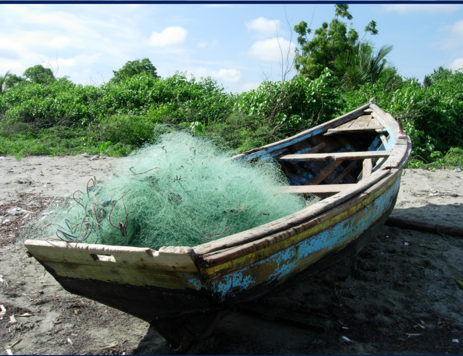
Embarcación pesca artesanal